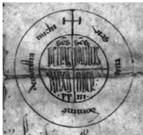
Rota auf einer Urkunde Papst Alexanders III. von 1175, Wikimedia Commons.