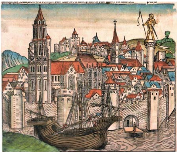
La chronique de Nuremberg, 1493, fol. 39, gravure sur bois de Michel Wolgemut et Wilhelm Pleydenwurff, source: Wikimedia Commons.

Organisation: Jörg OBERSTE (Regensburg) Boris BOVE (Paris) Rolf GROSSE (Paris)