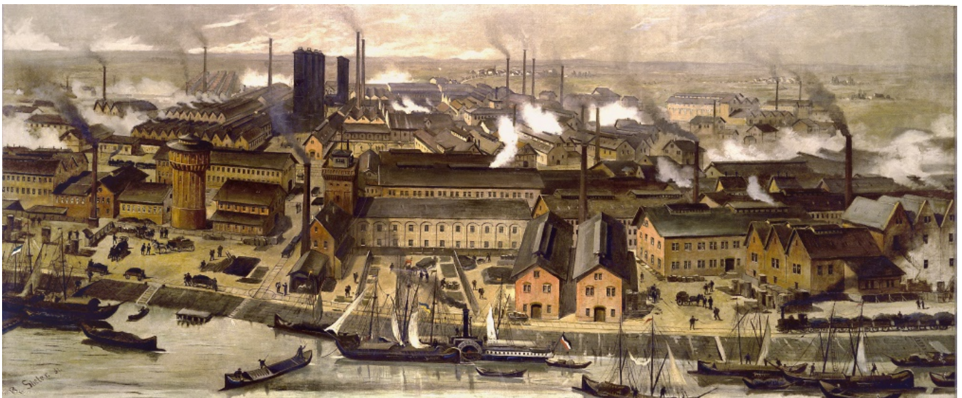
Image: Robert Friedrich Stieler (1847–1908), Badische Anilin- und Soda-Fabrik (BASF), Ludwigshafen, 1881, source: BASF-Archiv/Flickr, CC BY-NC-ND 2.0.